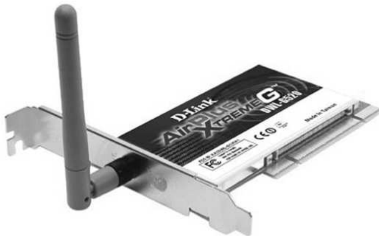
Рис. 1.2: Внешний вид адаптера Wi-Fi

Основная архитектура, особенности и службы 802.11b определяются в первоначальном стандарте 802.11. Спецификация 802.11b затрагивает только физический уровень, добавляя лишь более высокие скорости доступа.